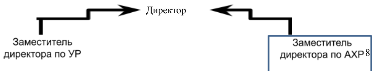
Схема оповещения родителей (законных представителей) о введении карантинных мероприятий и организации обучения вне здания МОУ «СОШ №15»